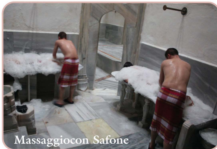
Massaggio con Sapone